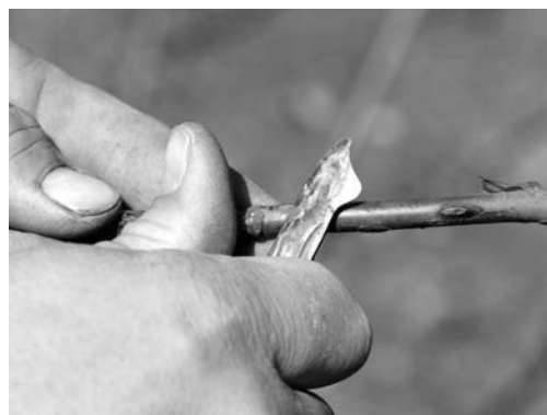
Das Edelaug wird am Edelreis abgenommen.