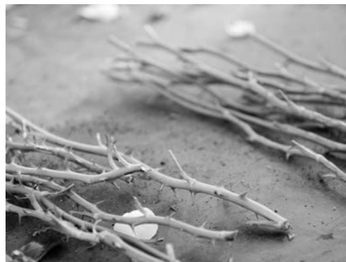
Vorbereitete Edelreiser einer wertvollen Sorte.