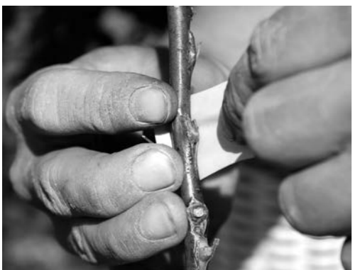
Verbinden des eingesetzten Edelauges in den Wildling.